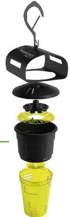
Vespacatch select Vetopharma