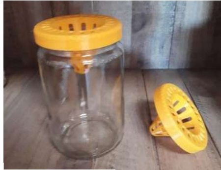
Piège nasse couvercle