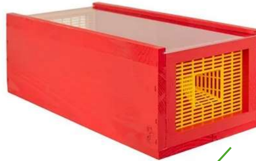
Piège Red Trap